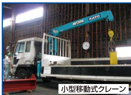
小型移動式クレーン