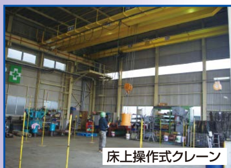
床上操作式クレーン