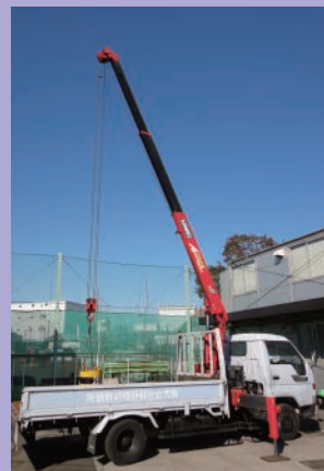
● 小型移動式クレーン